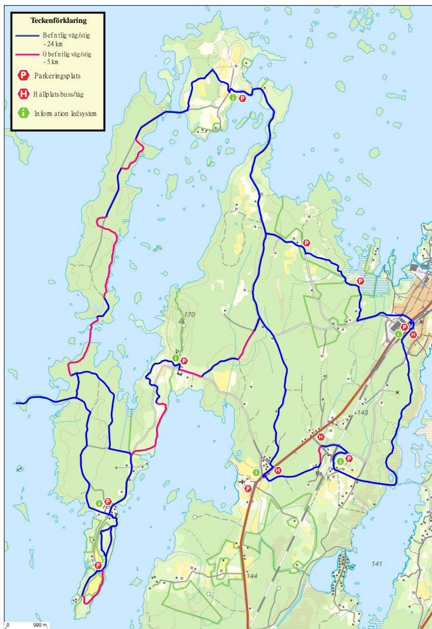
Bild 6 Kartan visar befintlig stig/väg i blått och obefintlig stig/väg i rosa, befintliga busshållplatser, parkeringsplatser samt förslag på platser för informationstavlor om leden.

På tre ställen, totalt cirka 100 meter, längs stigen vid Såganässjön krävs spång .