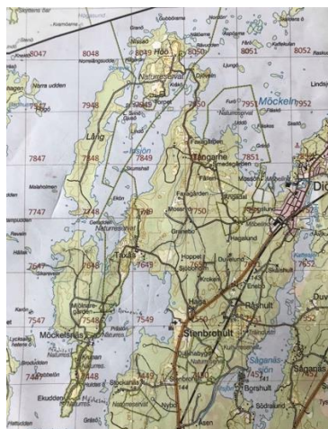
Bild 1 Karta över området.

I kommunens översiktsplan står att ”Kommuninvånare och besökare ska ges tillgång till områden för friluftsliv och rekreation vilket bidrar till ökad rörlighet och folkhälsa och ger människor ett rikare liv.” En av målpunkterna är ”Utveckla vandringsleder”.