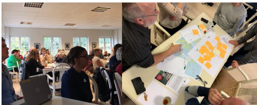
Bild 3 Öppna mötet 17 oktober med 55 deltagare på Möckelnäs Herrgård

Under sommaren och hösten har området rekognoserats. Information om förstudien i form av ett postutskick gick ut i början av juli till alla fastighetsägare i området. Kontakter togs också med föreningar och andra intressenter för att diskutera möjliga sträckningar av leden samt möjligheter och utmaningar för området. En referensgrupp har haft två möten, se bilaga 4 och 5. Den 17 oktober bjöds alla intressenter in till ett Öppet möte på Möckelnäs Herrgård. Ett sista referensgruppsmöte hölls den 22 oktober där det beslöts att en LONA-ansökan för genomförande skulle göras. Därefter har destinationsutvecklaren Johan Söderlund och miljöstrategen Cecilia Axelsson haft ett antal möten med berörda tjänstemän och representanter för nämnder och kommunstyrelsen.