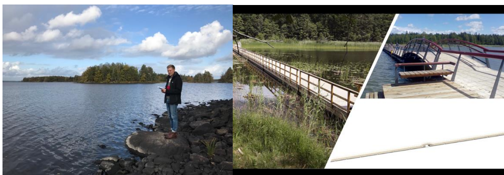
Bild 9 En flytbrygga på cirka 140 meter föreslås binda ihop ön Lång med halvön Möckelsnäs