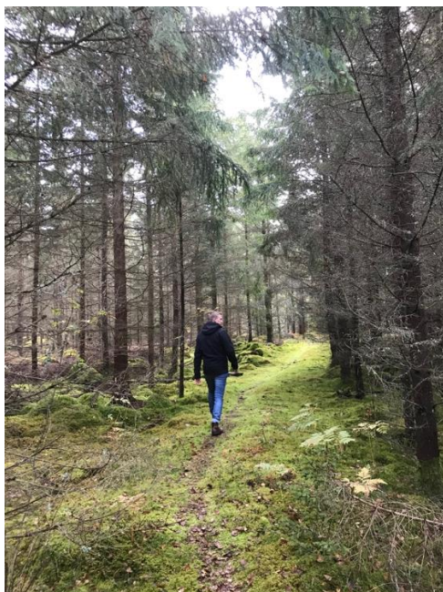
Bild 4 Rekognosering av befintliga stigar. Här från norra Möckelnäs till Sikareveln.

Under sommaren och hösten har projektledaren varit ute i fält och rekognoserat möjliga sträckor för vandringsleden både med och utan markägare och tjänstepersoner i olika årstider på olika platser, se bild 4.