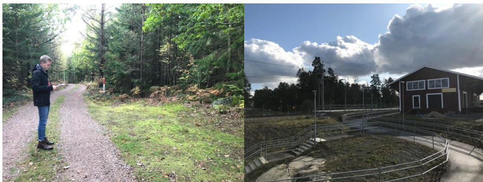
Bild 7 Markägarens förslag på parkeringsplats för besökare till Sikareveln