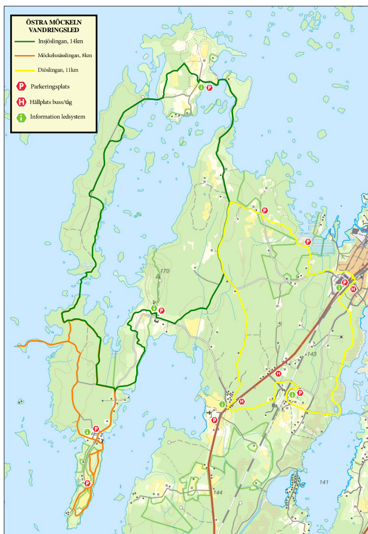
Bild 5 Kartan visar de tre slingorna som bildar Östra Möckelns vandringsled. De befintliga stigarna i reservaten visas inte på denna karta. Då informationsmaterial om Östra Möckeln vandringsled tas fram bör dessa stigar såklart vara med.

Av de 29 km som föreslås är det cirka 5 km som idag saknar stig , se bild 6, bilaga 2.