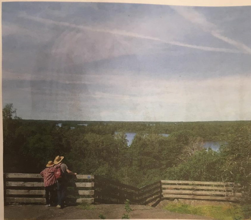
Utsikt från Taxås klint.

PRESS-klipp från Smålandsposten juli 2019