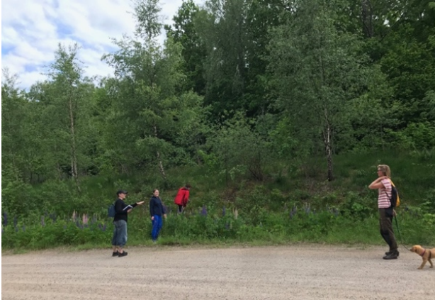
Bild 8 Platsen vid parkeringen där nya entrén föreslås ligga och nya vandringsleden starta.