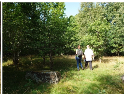
Bild 11 Den gamla betesmarken föreslås hägnas in i två delar med smålandsgärdesgård.