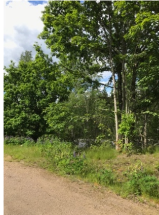
Bild 9 Bilden till höger visar var en stig från norra parkeringen kan leda fram till nya entrén.

Entrén bör göras tillgänglighetsanpassad och med en tydlig informationstavla, Bild 8. Gärna en med naturgrus uppgrusad ”serpentin stig”. Cirka tre bord med bänkar föreslås placeras på ”platån” bakom entrén. Detta medför att platsen blir mer befolkad och förväntas göra parkeringen säkrare. Parkeringen är en annan fråga som kommit upp i diskussioner under utredningen. I samband med att en ny entré görs kan förhoppningsvis en del av problemen kring parkeringen lösas genom röjning och annat, Bild 9. Stiftelsens styrelse framhävde särskilt en önskan om en helhetslösning gällande parkeringen och nya entrén.