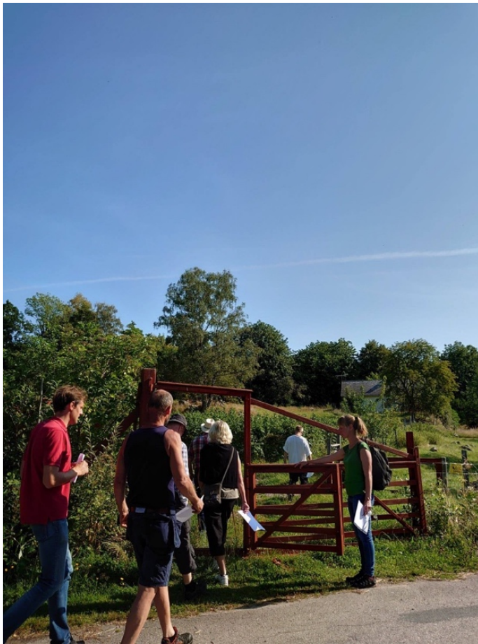
Bild 6 Förslaget är att tillgänglighetsanpassa de första 100 metrarna av leden från Caféet och parkeringen avsedd för rörelsehindrade. Detta för att så många som möjligt ska kunna få njuta av vyn uppe från backen.

En välgjord App föreslås också öka tillgängligheten på hela kulturreseptatet. En sådan App kunde komma alla besökare till del om man t ex vill förbereda sig inför besöket eller stilla sin nyfikenhet efteråt. Särskilt blir det en tillgång för lärare och elever som vill förbereda sig och/eller använda informationen i efterarbetet i klassrummet.