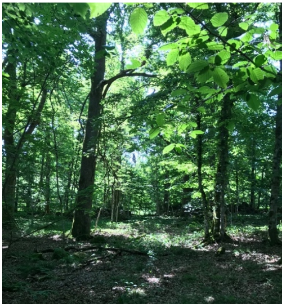
Bild 7 Leden föreslås bland annat följa spåret av den gamla traktorvägen som uppe på kullen går rakt igenom det nya området i nord-sydlig riktning. Vilobänk och gungor föreslås finnas här.

Skälen för Länsstyrelsen att besluta om utökningen av kulturreseptatet var områdets prioriterade bevarandevärden samt friluftsliv. De prioriterade bevarandevärdena i utökningen är de kulturhistoriska spår som finns som kan levandegöra markanvändningen och jordbrukets utveckling i Råshults by kring tiden för Carl von Linnés levnad. Spåren av åkerparceller, åkerhak och rösen samt det biologiska kulturarvet i form av hamlade träd, hävdgynnad flora och ängssvampar, är av stort värde att visas upp för besökaren. Det finns också viktiga naturvärden i nyckelbiotopen. Dessa naturvärden i form av bland annat sällsynta mossor, lavar och svampar är kopplade till de för landskapet ovanligt rikligt förekommande äldre ädellövträden.