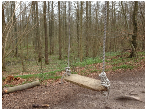
Bild 5 Ekbacken kan bli en plats för barn att röra sig mer fritt, ett önskat lekfullt inslag i Kulturreseptatet.

Övriga förslag markerade med bokstäver på kartan, Bild 3;