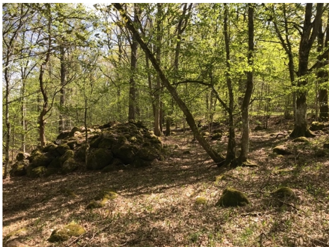
Bild 4 Ett mäktigt röse och i bakgrunden ett tydligt åkerhak påminner om äldre tiders jordbruk.

Uppe på backen, cirka 70 meter norr om stenvuren, föreslås en cirka 0,5 km lång vandringsring löpa österut. Den går via ett mäktigt röse och här syns tydliga åkerhak och spår efter åkerparceller, Bild 4. En liten informationstavla om jordbrukets historia på platsen vore passande här, D. Bild 3.