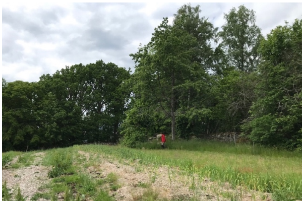
Bild 2 Under mötet med länsstyrelsen föreslogs att uppe på kullen göra plats för bänkar och bord där besökare sedan kan slå sig ner med egen picknick och beundra vyn över Kulturreseptatet Råshult.

Stiftelsen och länsstyrelsen delgavs rapporten för genomläsning och eventuella synpunkter före färdigställandet. Den 26 augusti hölls ett sista möte digitalt med länsstyrelsen och stiftelsens ordförande och sekreterare. På detta möte diskuterades främst rapporten och synpunkterna fördes in direkt i rapporten.