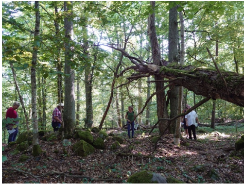
Bild 12 En riskbedömning görs alltid av länsstyrelsen och påverkar hur leden dras i kulturreseptatet.

Stiftelsens styrelse vill gärna ha ett möte och en konkret diskussion med länsstyrelsen angående vem som ansvarar för långsiktig skötsel, för vad och hur mycket, till exempel gällande backen bakom caféet. Alla var dock överens om att det är viktigt att hålla det öppet med vall eller liknande. De delar som föreslås tillgänglighetsanpassas kräver åtgärder i form av till exempel anpassat underlag. Länsstyrelsen håller på med en tillgänglighetsplan där detta föreslås ingå. En annan viktig sak är behovet av att göra en riskbedömning och eventuellt vidta åtgärder längs den planerade leden, före den tas i bruk. Detta eftersom det i vissa delar av området finns en del hängande döda grenar med mera, Bild 12. Detta kommer länsstyrelsen göra före leden tas i bruk samt vid den återkommande tillsynen av leder som länsstyrelsen gör i kulturreseptatet.