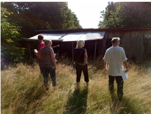
Bild 10 Den gamla ladan med utedass föreslås tas bort helt eller delvis.

Den gamla ladan med utedass uppe vid stenmuren föreslås tas bort helt eller delvis för att ge plats för en informationstavla, trevligare vy och ”ingång” till området på backen, bild 10. Ett första steg kunde vara att ta bort väggarna och låta taket vara kvar som regnskydd vid samlingar och fika. Om det visar sig att detta inte kommer till användning kan ladan rivas helt.