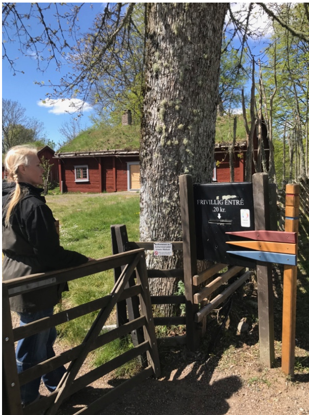
Bild 1 Ledmarkeringar för befintliga leder i Kulturreseptatet Linnés Råshult idag.